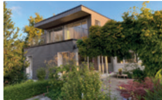
Aufstockung EFH 8708 Männedorf