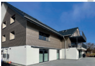
Neubau 2 FH 8608 Bubikon