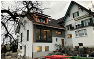
Ersatz Neubau Ökonomiegebäude zu Wohnung 8708 Männedorf