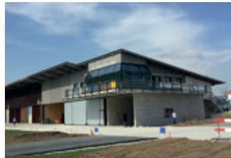
Ersatz Neubau Flugplatz Speck 8320 Fehraltorf