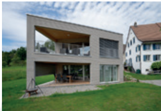
Neubau 2 FH 8712 Stäfa