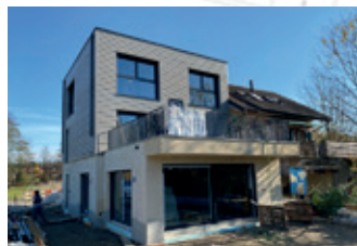
Neubau EFH 8617 Mönchaltorf

Wir freuen uns, Ihr Projekt in Angriff nehmen zu dürfen.